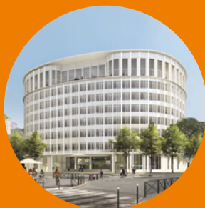
Sense Norma Bureaux 18 500 m 2 Synthèse technique et architecturale

Entouré de talents, entrepreneur dans l'âme, passionné d'architecture et de construction, cela lui permet de décliner les compétences des équipes dans de nombreux domaines : bureaux, hôpitaux, EPHAD, hôtellerie, bâtiments culturels, industriels, scolaires et sportifs.