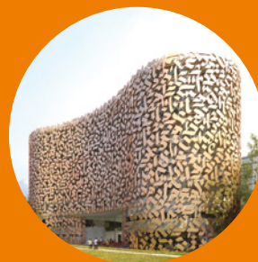
C.U.I.P. Résidence étudiante – Auditorium Synthèse technique Dossier EXE CVCD – PLB